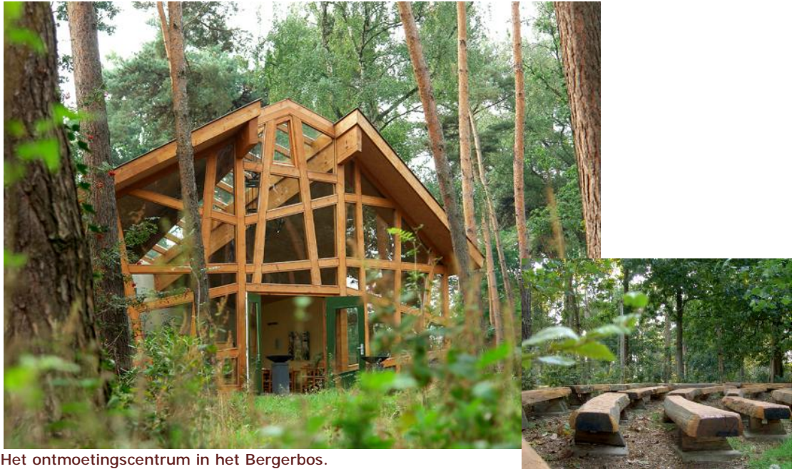
Het ontmoetingscentrum in het Bergerbos.

Een mooi voorbeeld is de natuurbegraafplaats 'Bergerbos' in Nederlands Limburg